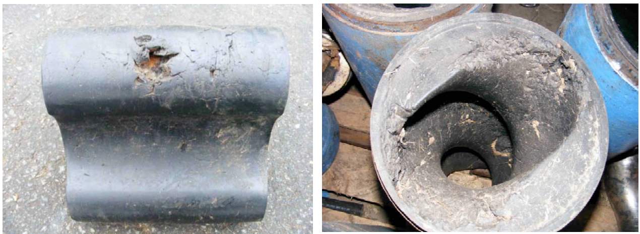
Abb. 4: Beschädigter Rotor einer Drehkolbenpumpe (links) und eines beschädigten Stators einer Exzenterpumpe (rechts).

Nachdem die Drehkolbenpumpe durch eine Exenterschneckenpumpe ersetzt wurde, deren Stator in ähnlicher Weise beschädigt wurde wie die Drehkolben, konnte durch die erheblich längeren Dichtfläche des Stators die Standzeit der Pumpe bei gleicher Anwendung um den Faktor 15 bis 20 verlängert werden. Hierdurch wurde ein deutlich höheres Maß an Betriebssicherheit erreicht, was zu einer deutlichen Kostenreduktionen führte.