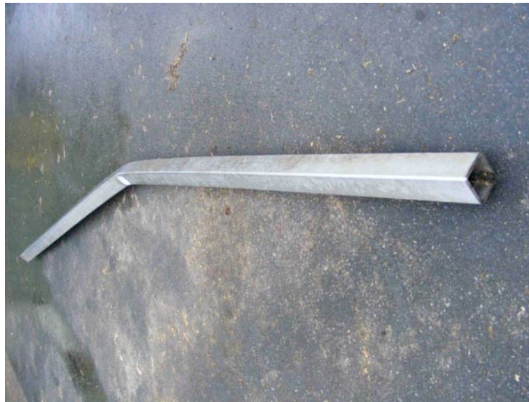
Abb. 3: Vom Gärgut im Fermenter eingedrückter Rührwerksmast.

Die Rührwerke sind nach wie vor im Einsatz und für die Anwendung geeignet. Allerdings liegt der Eigenenergieverbrauch der Anlage (bei einer elektrischen Leistung von 536 kW und dem Einsatz an festen Substraten von 45 % Festmist, 26 % Grassilage und 29 % Maissilage plus Rinder- und Schweinegülle) mit ca. 15 % deutlich über dem einer Maisvergärungsanlage.