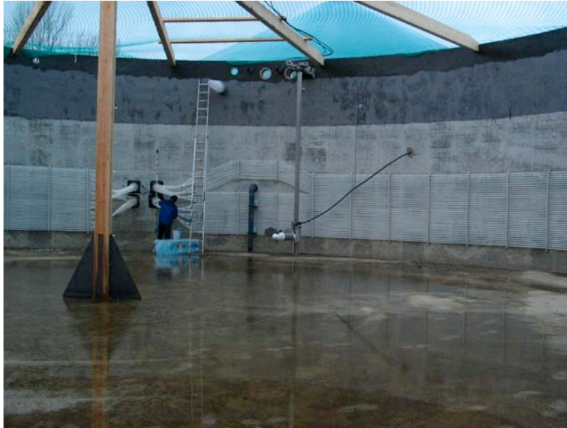
Abb. 2: Beispiele für Fermenterheizungen in einer landwirtschaftlichen Biogasanlage zur fast ausschließlichen Vergärung von Maissilage.

ein für die Vergärung günstiges Temperaturniveau erreicht. Das Beheizen von Fermentern über externe Wärmetauscher ist ebenfalls möglich.